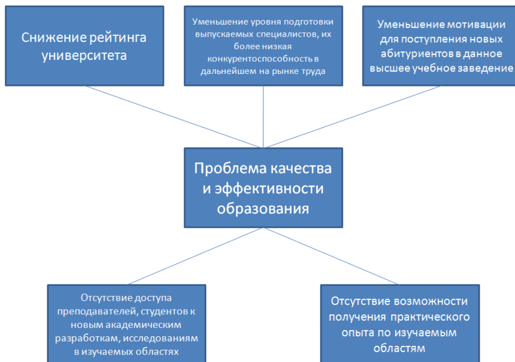
Рисунок 1. Дерево проблем

В качестве проблемы для проекта была определена проблема качества и эффективности образования на факультете. Данная проблема имеет множество проявлений, однако было решено сконцентрироваться на двух её наиболее важных причинах (см. рис. 1).